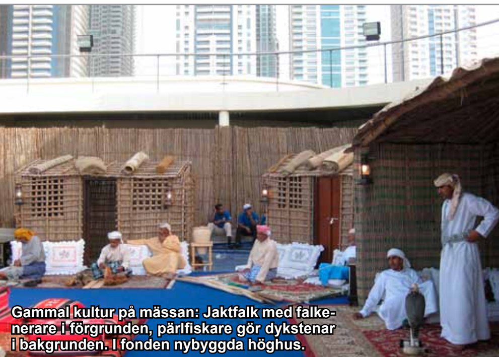
Gammal kultur på mässan: Jaktfalk med falke-nerare i förgrunden, pärlfiskare gör dykstenar i bakgrunden. I fonden nybyggda höghus.