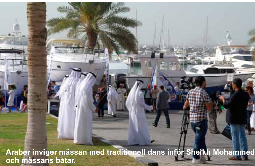
Araber inviger mässan med traditionell dans inför Sheikh Mohammed och mässans båtar.