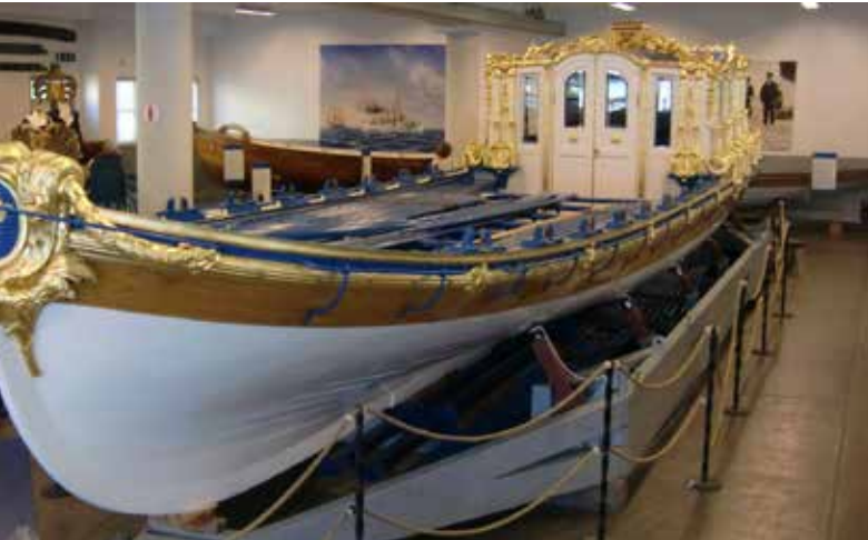
Replik på Roddslopen Vasaorden som byggdes efter Gustav III:s besök i Venedig på 1700 talet.