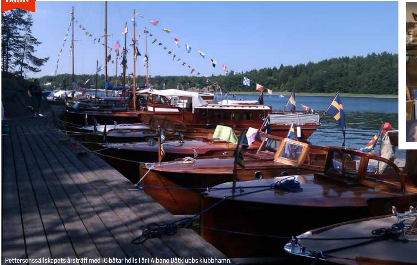
Pettersonsällskapets årsträff med 16 båtar hölls i år i Albano Båtklubbs klubbhamn.